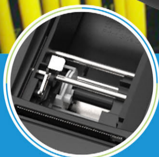
纸张宽度无级调整