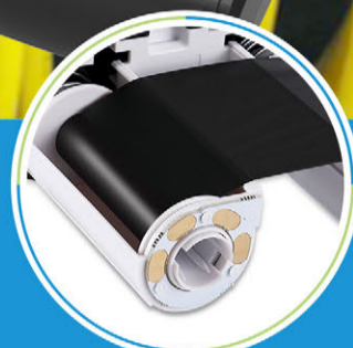
一体式碳带独家防伪芯片