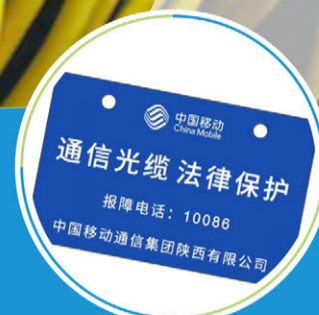
厚标签的可靠打印